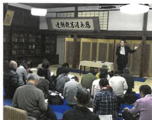
文化財の基礎知識についての講演

主催者から一言 当日は京都市内のみならず、府外から、またお子様連れや女性も多くご参加いただきました。本物に触れ、講話を通して「文化財」への認識が深まりました。御支援に御礼申し上げ、今後とも地道な活動を続けたいと思っています。